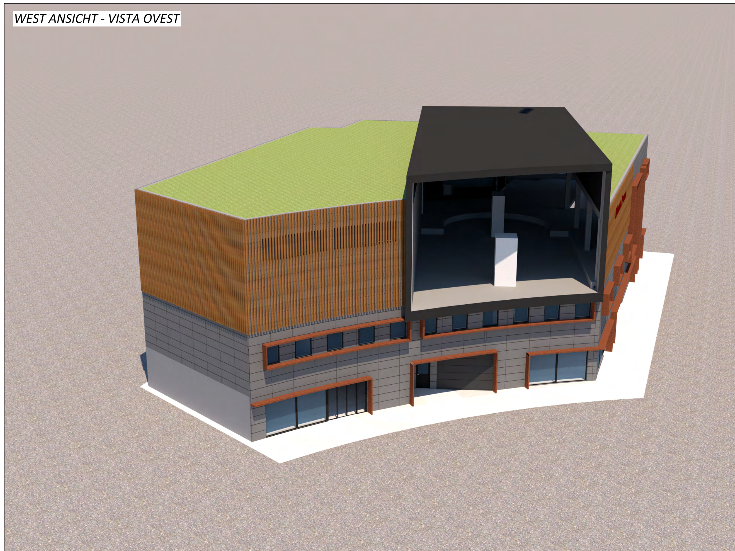
WEST ANSICHT - VISTA OVEST