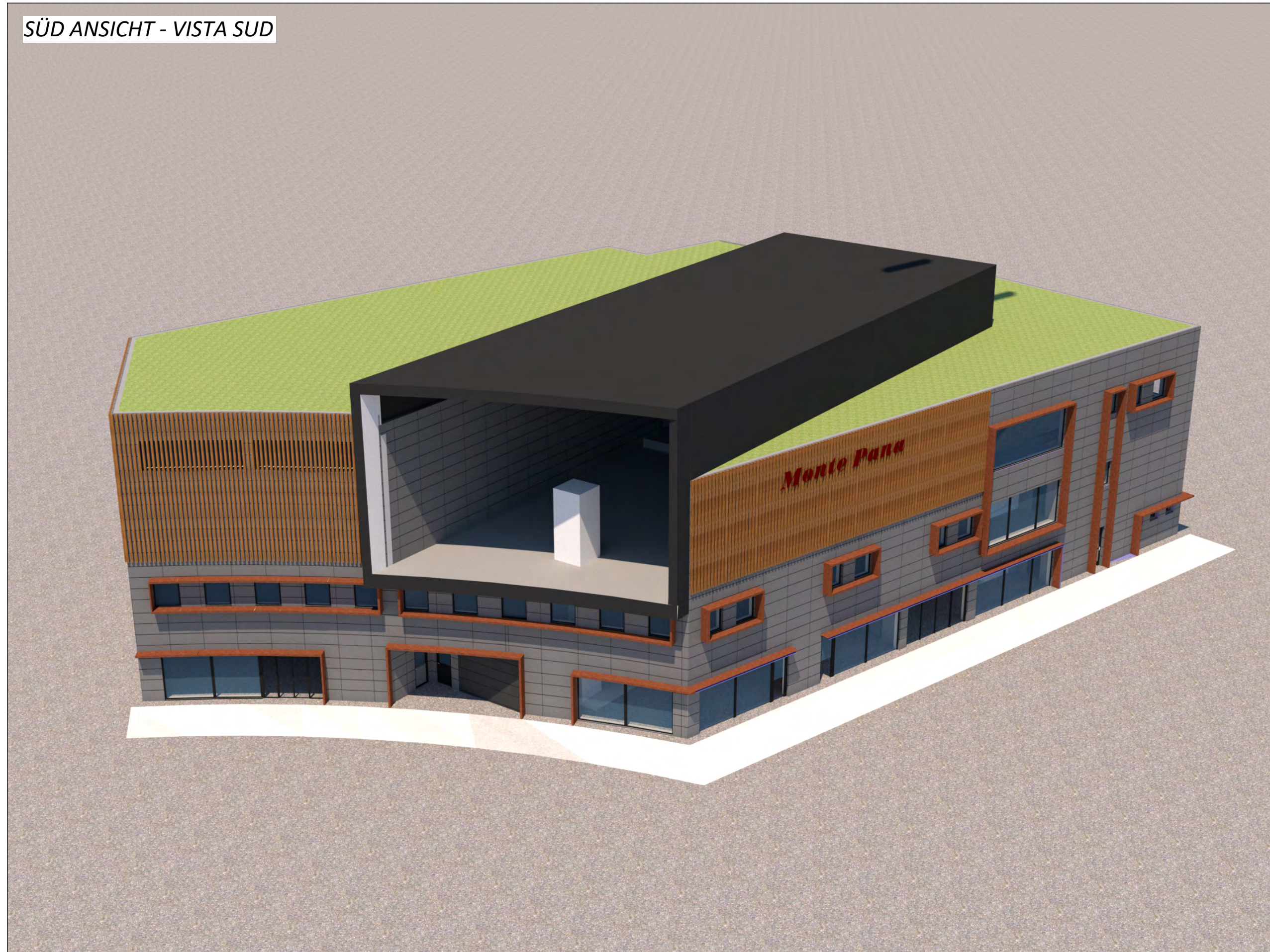
SÜD ANSICHT - VISTA SUD