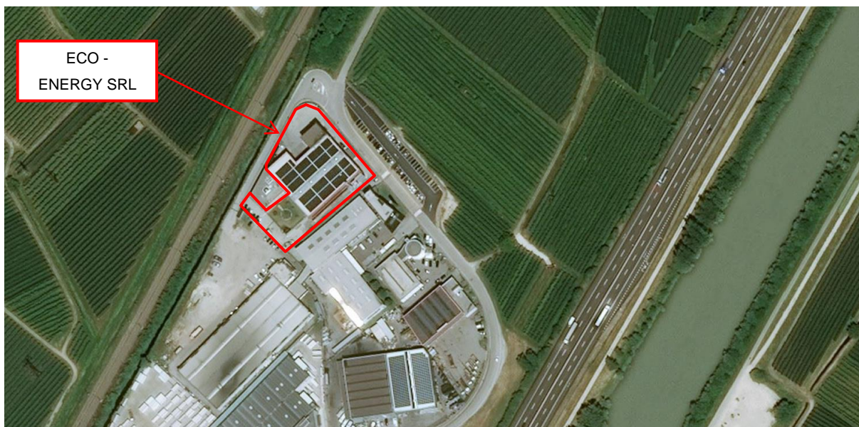
Ubicazione dell'impianto ECO-ENERGY s.r.l.