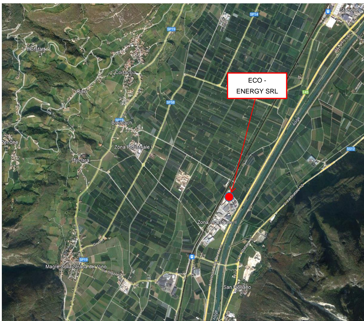
Ubicazione a grande scala dell'impianto ECO-ENERGY s.r.l.

L'area in esame è compresa, in direzione ovest, entro la tratta ferroviaria "Verona-Bolzano" e la strada provinciale SP 20 e in direzione est, entro l'Autostrada A22 Modena-Brennero ed il Fiume Adige.