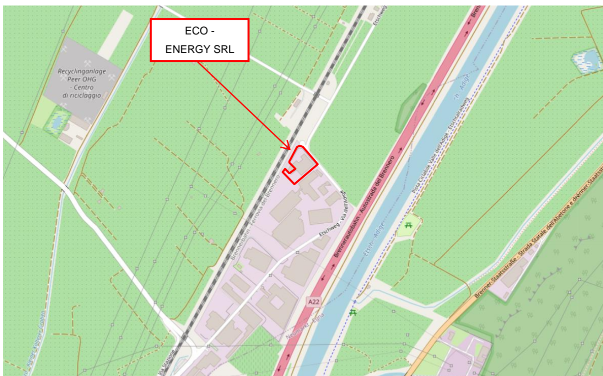
Ubicazione dell'impianto ECO-ENERGY s.r.l.